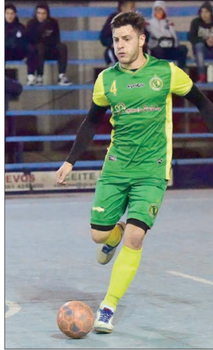
El Poli se mide ante Don Orione.