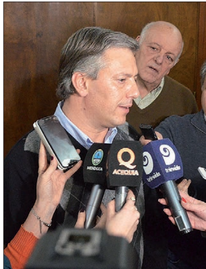
El nuevo titular del organismo tiene mucho por hacer.

Según la información relevada por el Senasa, desde 2008 el desempeño del Iscamen daba cuenta de prácticas poco