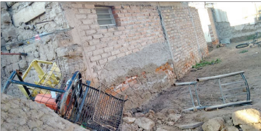
La Comuna ya ha registrado unos 40 pedidos de asistencia de casas en estado crítico.

Desde la Comuna se está relevando y evaluando la problemática que existe en cuanto a peligro de derrumbe y sus posibles soluciones. En este sentido, la Dirección de Defensa Civil, la Dirección de Obras Privadas y la Oficina de Enlace, dependiente de la Dirección de Asuntos