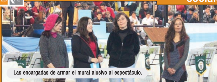
Las encargadas de armar el mural alusivo al espectáculo.