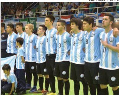
La Selección tras un sueño.