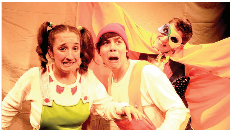
Diferentes propuestas se presentan en los espacios recreativos del departamento.

• El Resguardo: actividades desde las 15.30. Domingo 17, show de magia en el CEDRYS N°5, calle Armada Argentina y Emilio Civit. Jueves 21, espectáculo musical de Los Musilocos en el CEDRYS N°22, calle Lisandro Moyano y Amanecer.