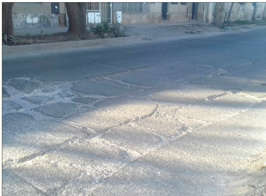
Las laterales se están viendo perjudicadas por el paso del tránsito pesado.

Los vecinos que viven en los barrios ubicados en las inmediaciones de la calle San Martín sufren las consecuencias de las obras de repavimentación que está llevando adelante la Comuna.