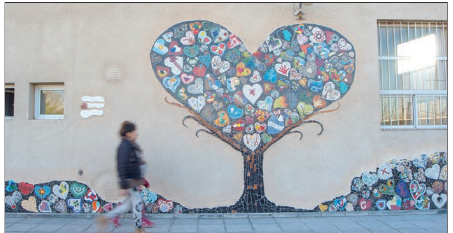
Así luce el mural realizado en homenaje al médico cardiocirujano.

En una acción simultánea, 112 ciudades de 19 provincias, con el objetivo de destacar la figura del reconocido médico cardiocirujano René Favalaro, realizaron un corazón de mosaicos en forma de mural.