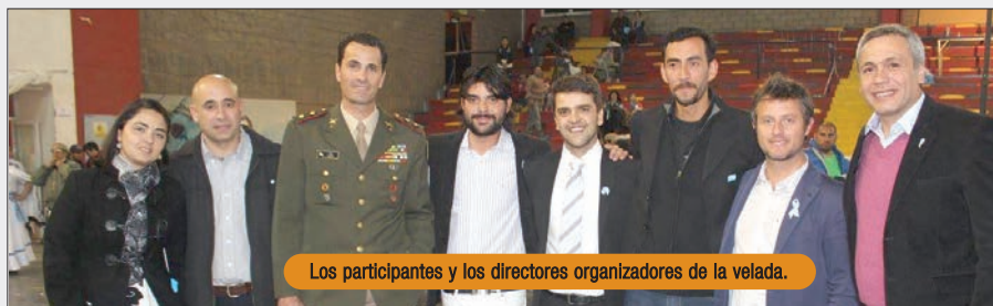
Los participantes y los directores organizadores de la velada.