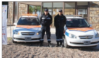
Los preventores de la Comuna custodian los lugares.

Además, el personal del Informador Turístico está presente durante el día, colabo-