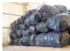
Ya juntan basura.