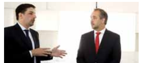
GODOY CRUZ PÁGINA 5