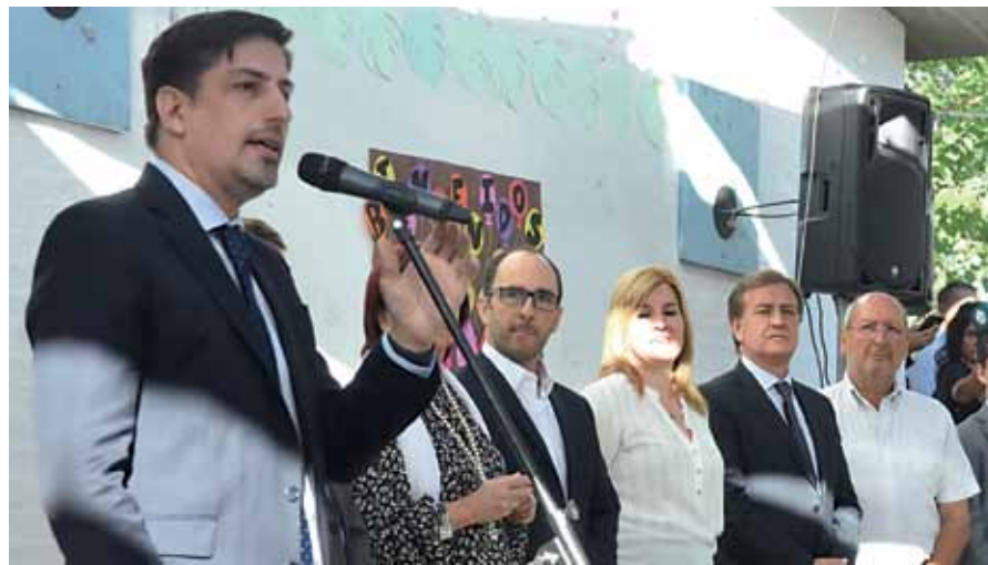
El ministro de Educación de la Nación, Nicolás Trotta, inauguró el ciclo lectivo.

En los últimos cuatro años fueron intervenidos