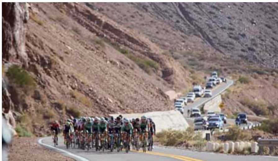
La Vuelta de Mendoza acaparó la atención de los conductores.

El distrito fue escenario de tres eventos que congregaron a cientos de turistas y colmaron la capacidad hotelera.