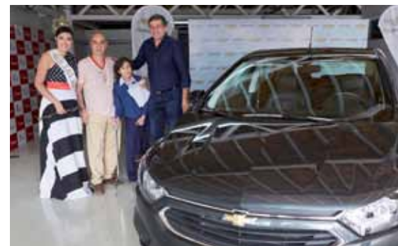
El afortunado ganador, junto a la reina vendimial y el intendente.