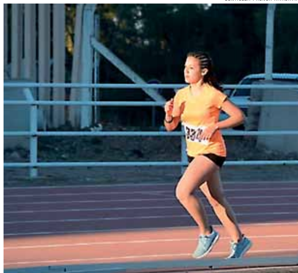
Empieza la acción oficial de los atletas locales.