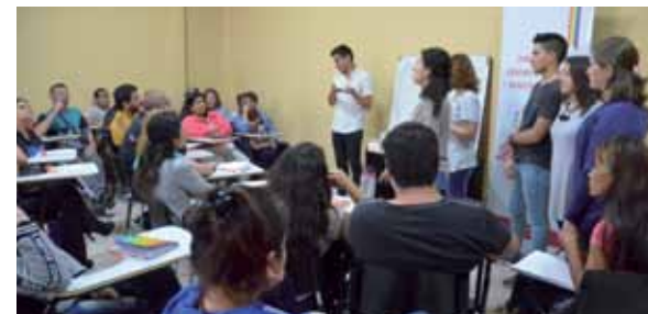
Está destinado a emprendedores inclusivos del departamento.

La preinscripción es realizada hasta el 5 de marzo en el Área de Educación (San Miguel 1434), de lunes a viernes de 8 a 14, con cupos que son limitados.