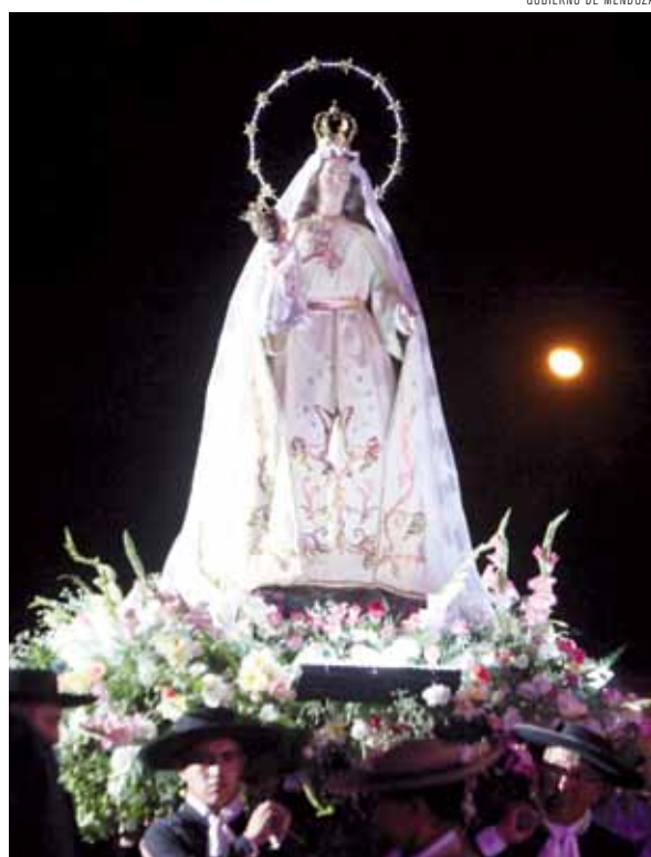
La Virgen de la Carrodilla.

La Bendición de los Frutos, que abre el calendario oficial de la Fiesta Nacional de la Vendimia, será mañana a las 21 en el anfiteatro del parque Agnesi, de San Martín.