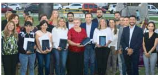
Funcionarios, junto a las mujeres distinguidas en el 2019.