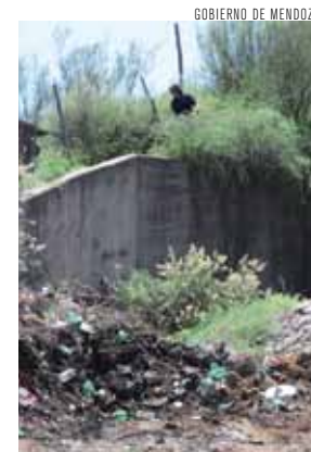
Piden más conciencia.

Del mismo modo, el funcionario aseguró -teniendo en cuenta la cantidad de diques de atenuación de crecidas, como también los colectores aluvionales- que Mendoza puede ser considerada como una de las provincias más protegidas en esa materia en nuestro país.