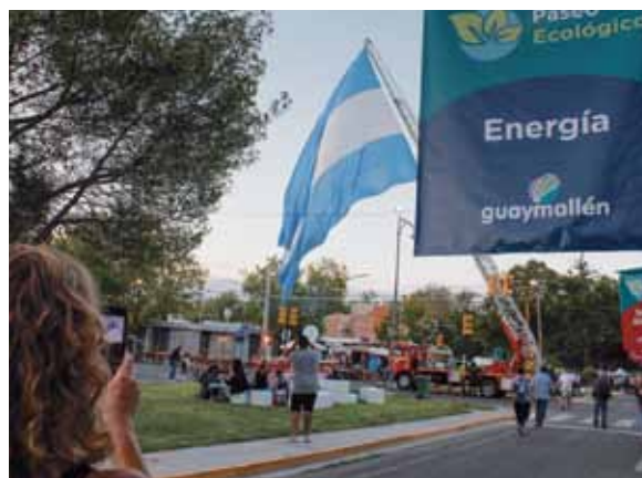
El gran atractivo del bulevar.

La educación y la conciencia vial fueron además consignas importantes que convocaron a una gran cantidad de público interesado en experimentar a través de la tecnología.