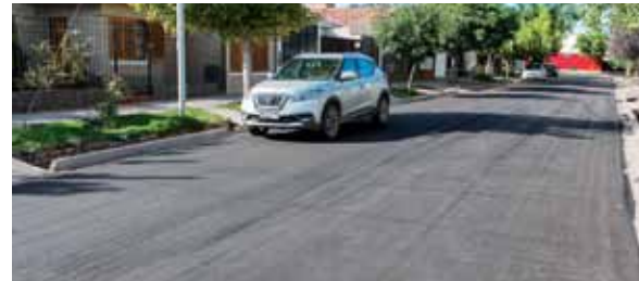
Las calles lucen a nuevo en los barrios de la zona.