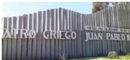
LUJÁN DE CUYO PÁGINA 6