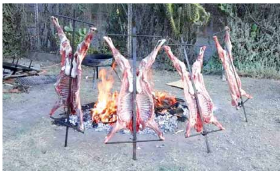
Parte de lo que puede ser degustado en la Vendimia del Trabajador.

Por tercer año consecutivo será realizado el encuentro, que tiene base en el frigorífico recuperado La Lagunita.