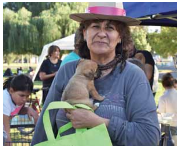
El cuidado de las mascotas será estudiado en las escuelas.

Además mencionará los servicios que presta el Municipio y les brindará el contacto para pedir turnos gratuitamente para castro de mascotas, vacunaciones antirrábicas,