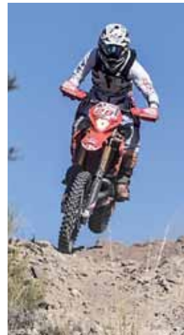
Vuelven a correr el enduro.