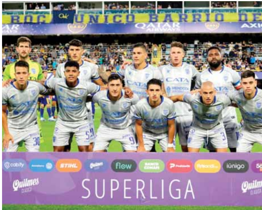
El equipo bodeguero que jugó en la Bombonera el fin de semana pasado.