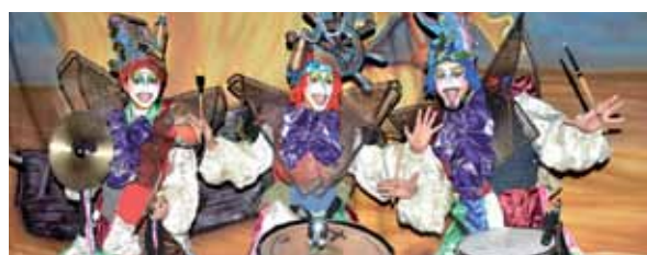
Fiesta grande hubo en Las Catitas.