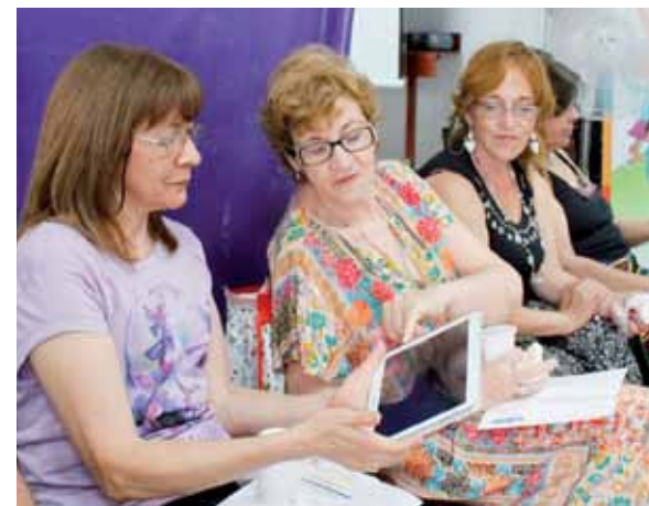
Una buena oportunidad para que los adultos mayores aprendan.

Las inscripciones están abiertas de lunes a vier-