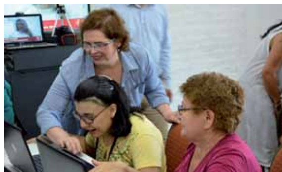
El taller brinda conocimientos para el uso de la tecnología.

Su objetivo es brindar acceso a los conocimientos necesarios para comprender y utilizar las nuevas tecnologías, priorizando el uso de la compu-