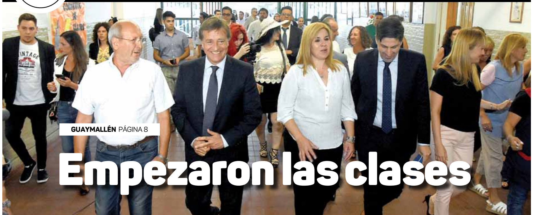
GUAYMALLÉN PÁGINA 8