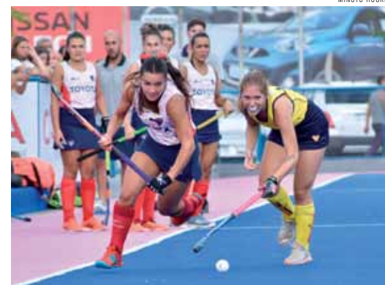
Los Tordos y Murialdo, siempre protagonistas.