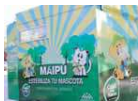
El móvil de castración.

El móvil de castración de la Comuna, que ofrece distintos servicios gratuitos para mascotas, continúa recorriendo distritos y, por eso, desde el lunes estará en Barrancas.