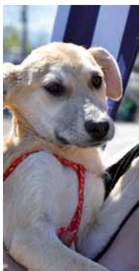
Las mascotas buscan un hogar.