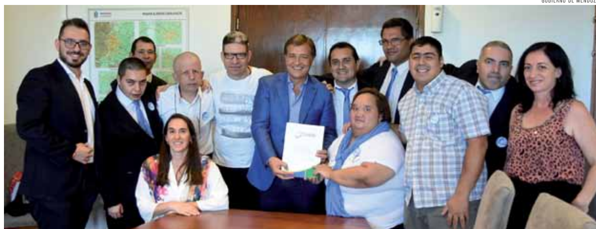
Quiénes asisten al instituto Thadi tuvieron una jornada distinta junto al gobernador de Mendoza.