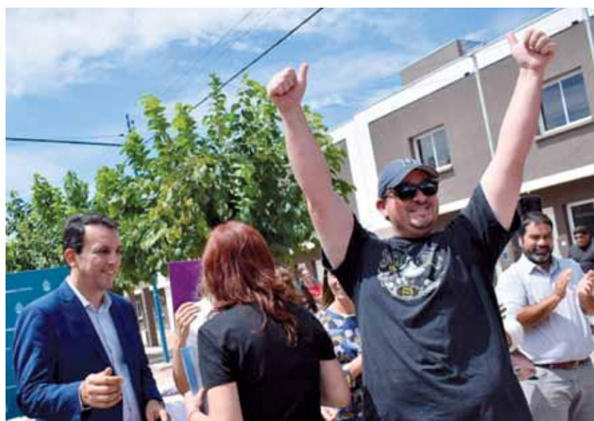
Los vecinos celebraron en el acto de entrega de llaves.

El Gobierno entregó viviendas individuales y dúplex en el barrio Solares, de San Francisco del Monte.