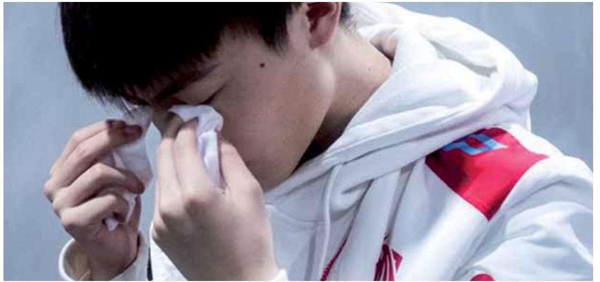
La presencia del virus ha hecho que la liga china sea aplazada sin fecha de inicio.