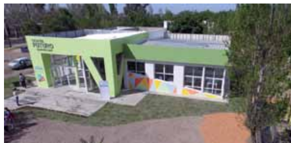
El evento será libre y gratuito.

Desde peluquería hasta tecnología abarca la variedad de capacitaciones que ofrece el espacio público educativo pensado para jóvenes, con el fin de que estos adquieran conocimientos que los inserten rápidamente en el mundo laboral.