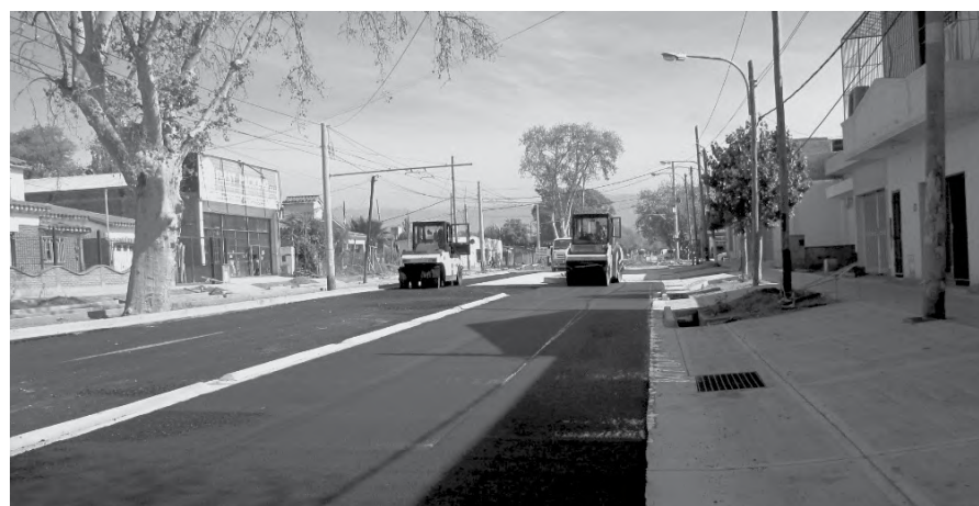
Sigue adelante la modernización de la concurrida calle.

Continúa la recuperación de la transitada calle, una de las vías troncales más importantes de Guaymallén.