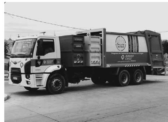
Los martes ya no habrá recolección domiciliaria.

Además, destacó que este esquema "permitirá bajar la cantidad de emisiones de gases de efecto invernadero y posibilitará que los trabajadores de la recolección tengan me-