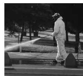
Trabajaron más de 100 personas.

más de 100 personas, 40 trajes especiales de protección, una planta de producción continua de solu-