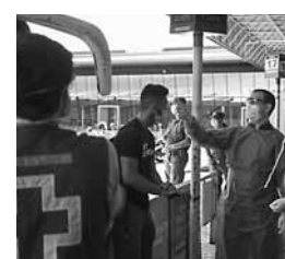
Hay control en el transporte.