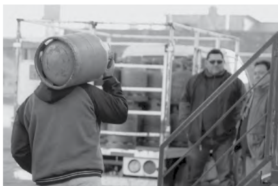
Ya están definidos los puestos de venta.