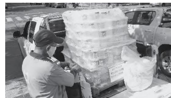
Los centros de salud recibieron los materiales.