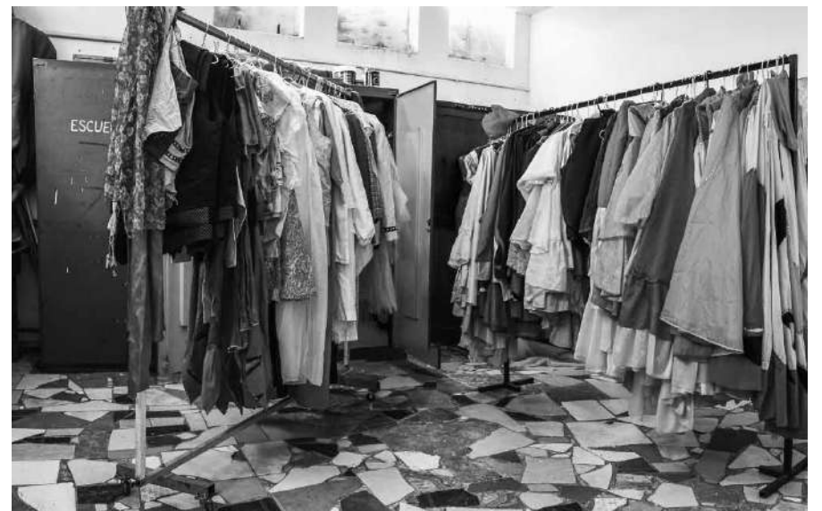
Parte de la vestimenta que se logró recuperar.

El equipo de Cultura trabaja en el inventario y recuperación de aquellas prendas que se confeccionaron a lo largo de los años, muchas de ellas olvidadas en depósitos.