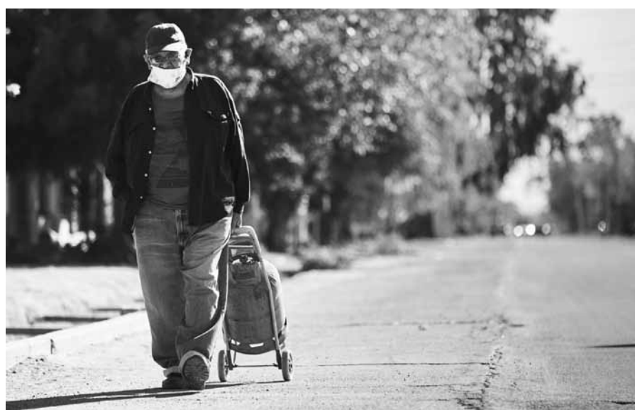
El operativo municipal recorrerá el departamento hasta el 29 de mayo.

A través del programa Mercado municipal, los vecinos de Las Heras pueden acceder a la compra de alimentos.