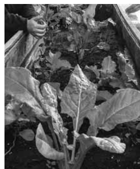
La huerta del refugio.

El curso y la siembra sirvieron, además, como es-