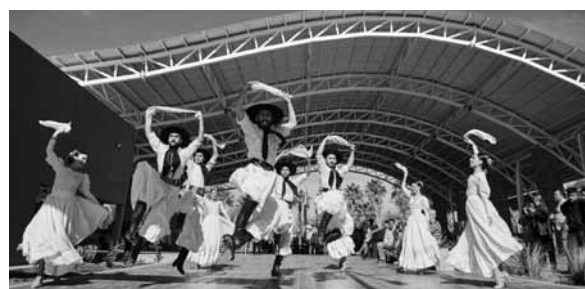
Convocan a los artistas a sumarse a este relevamiento.

La Comuna de Las Heras está actualizando la base de datos de hacedores y organismos culturales del departamento en las diversas disciplinas del arte y la cultura.