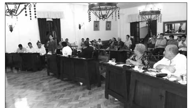
Los ediles tendrán una nueva manera de trabajar.

La nueva norma es el expediente 053/2020 en el que previamente ediles del oficialismo y la oposición trabajaron con el fin de que las sesiones virtuales tuvieran validez municipal. Así y desde ahora tanto las sesiones como la labor parlamentaria del cuerpo deliberativo y el trabajo de las distintas comisiones podrán realizarse sobre plataformas como Zoom, herramienta que se ha impues-