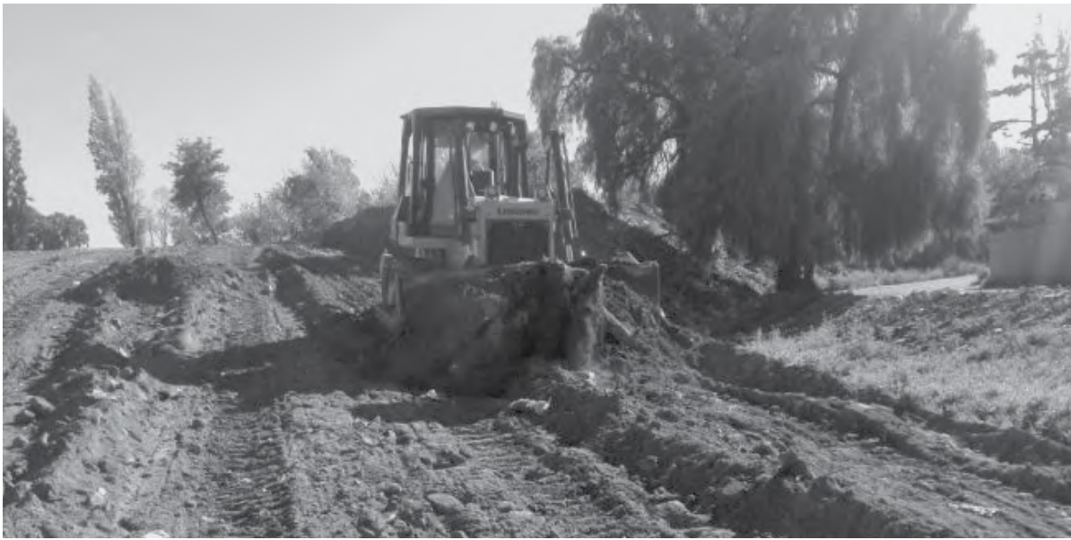
El proyecto del nuevo pulmón verde del departamento contempla un importante circuito de ciclovías.