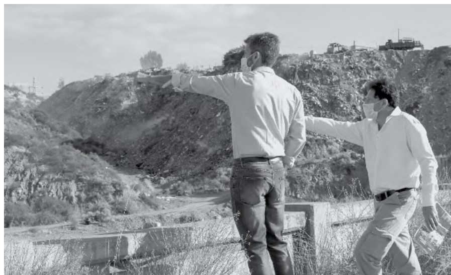
Ciudad y Provincia trabajarán en la zona.