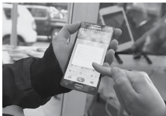
Si tenés un teléfono de más, donalo. Hay chicos que lo necesitan.

El Municipio de Guaymallén se sumó a la campaña solidaria de la Dirección General de Escuelas, "Tu ayuda nos conecta". Esta acción solidaria apunta a recolectar 10 mil celulares que serán entregados a los estudiantes que no cuentan con ningún dispositivo en su hogar y, de este modo, garantizar la continuidad pedagógica de manera digital y fortalecer la conectividad en los sectores más vulnerables.