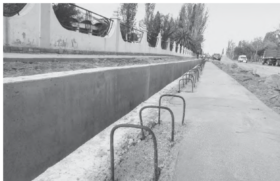
Ya se trabaja en la etapa final de la remodelación de la transitada calle.

La arteria será asfaltada desde Capilla de Nieve hasta el canal Lagunita. Hubo trabajos previos a nivel hídrico.