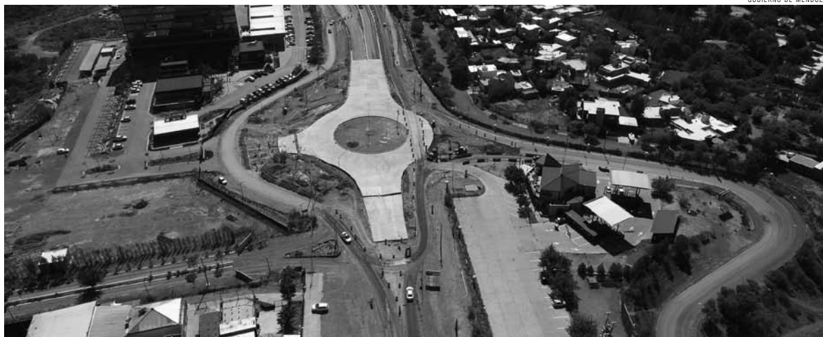
Con un ritmo atenuado, pero constante, trabajan en la obra vial.