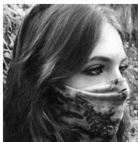
Hay varios diseños para elegir.