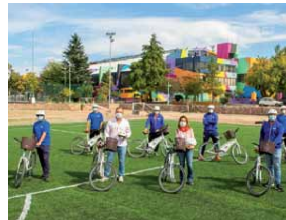
Los profesores de educación física harán los trámites en bicicleta.

Los interesados deberán llamar al 2614813940 y detallar datos personales, detalles del trámite, y dirección. El operador le dará el nombre y número de DNI del profesional que lo visitará. Al momento de la visita se seguirán los