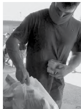
Vecinos recibieron la ayuda.

"Estamos entregando junto con la Dirección Ge-