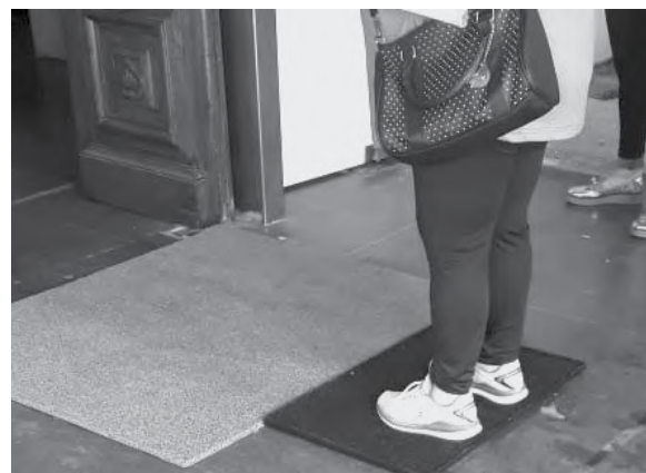
Las alfombras son embebidas en sales de amonio.

Se trata de alfombras embebidas de sales de amonio cuaternario, cuyo fin es disminuir el riesgo de transmisión de la CO-