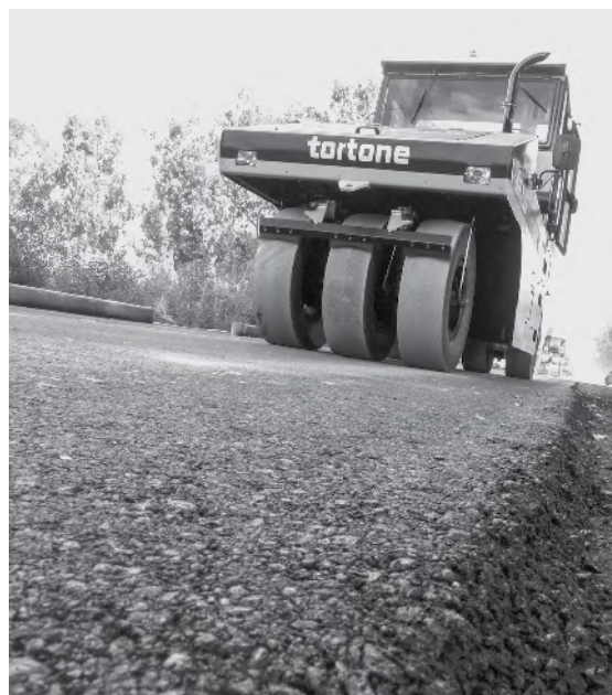
La tarea ya fue completada.