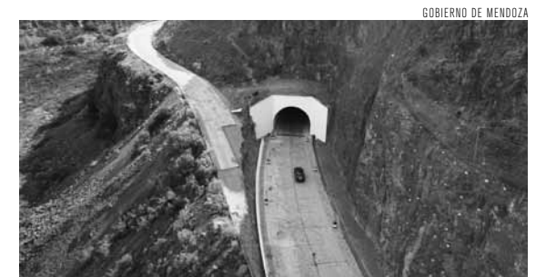
Después de 20 años, los vehículos volvieron a circular por la ruta.