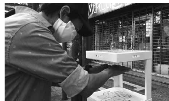
Los primeros están ubicados en los alrededores de la Plaza.