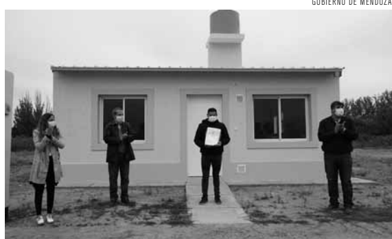
La felicidad de contar con la casa propia.