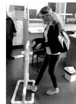
Los nuevos dispensers.