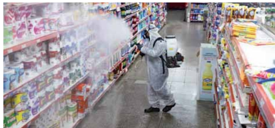
El Municipio multiplica las acciones preventivas ante los contagios de coronavirus.

En el marco de la detección de un caso positivo de coronavirus en el Átomo