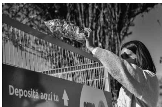
Allí los vecinos podrán dejar sus envases de plásticos.