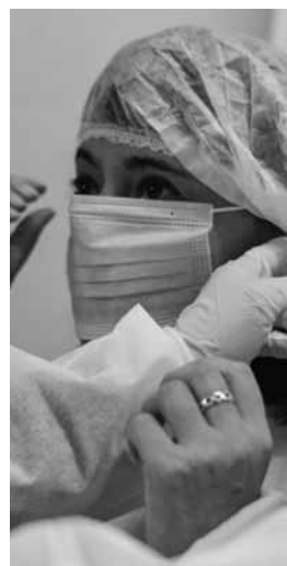
Realizaron tests al personal.

El operativo lo desarrollan en conjunto el Ministerio de Salud, Desarrollo social y Deportes de Mendoza y la Secretaría de Desarrollo Humano de la Comuna. La cartera provincial aportó los reacti-