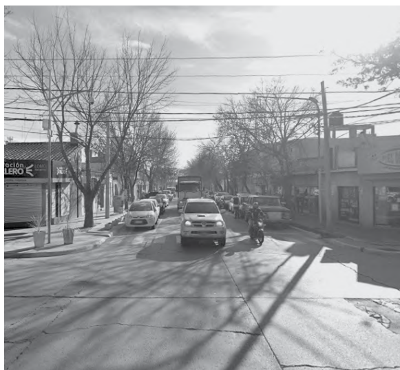
Se trata de una de las arterias con mayor actividad comercial.

La intención de esta disposición es descomprimir los focos de aglomeración civil para favorecer el distanciamiento social. En paralelo, en las inmediaciones de la calle, también se profundizará en la implementación de las medidas preventivas sugeridas por los protocolos sanitarios.