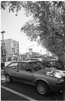
Hay que pagar tarjeta.