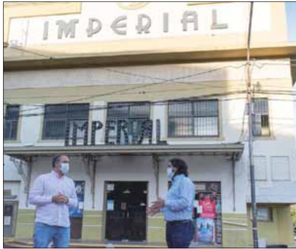
El programa promueve la participación de los artistas locales.

“El programa promueve la cultura y el talento de los artistas y distintos hacedores culturales, es un modelo de adaptabilidad de gestión cultural a su