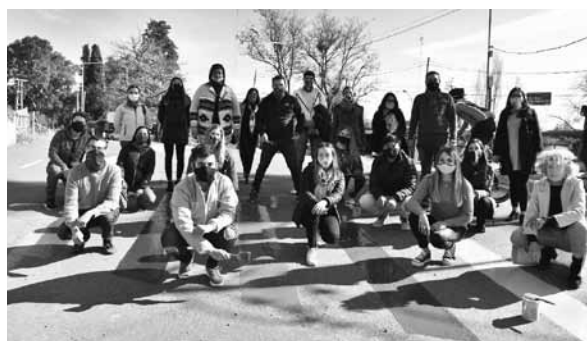
Está ubicada en la intersección de La Pampa y la Ruta Panamericana.