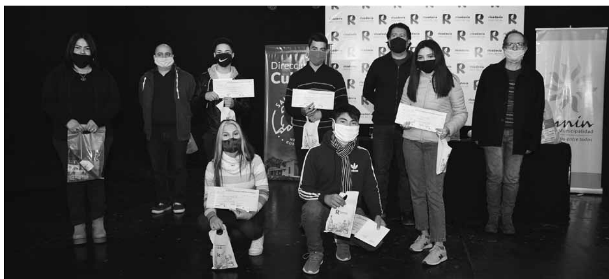
Los ganadores junto al jurado del concurso, en el teatro Biancho de Rivadavia.

Entregaron las distinciones a los jóvenes que obtuvieron los primeros puesto del concurso "Tu canción puede cambiar el mundo".