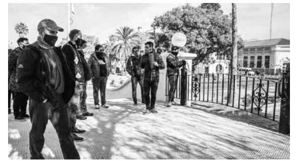
Llega el Walking tour en San Martín.