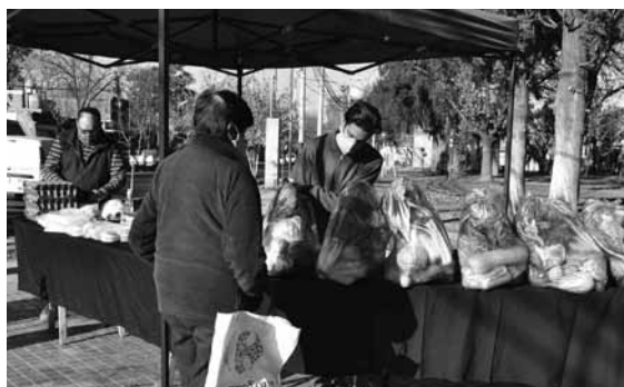
Conocé los lugares donde se venderán los productos.