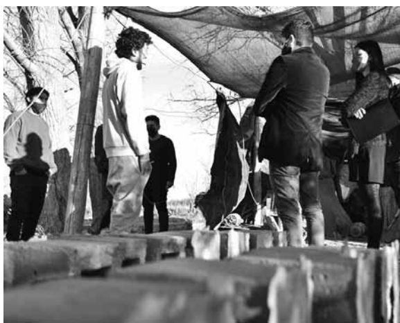
La intendenta visitó a los jóvenes en sus lugares de trabajo