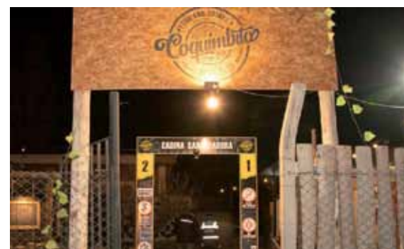
Buscan garantizar las medidas preventivas.