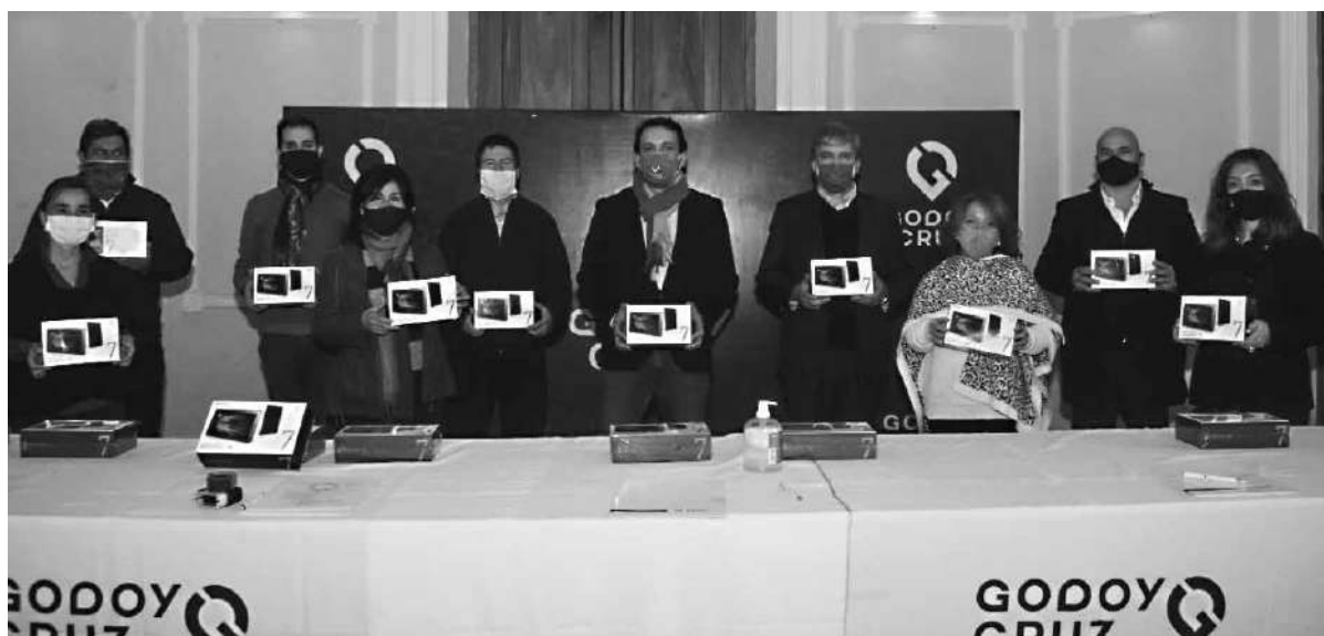
Estuvieron en el acto representantes del Banco Supervielle, autoridades de la Municipalidad y directivos de las escuelas.