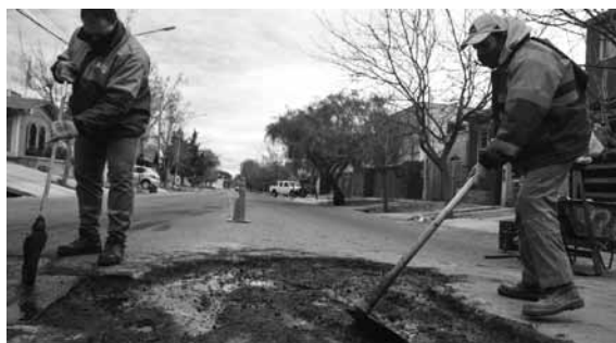
Las acciones se extienden por toda la Ciudad.

govar con al menos dos días de antelación, para tomar las medidas de higiene y organización necesarias para el cuidado de la salud de todas las personas.