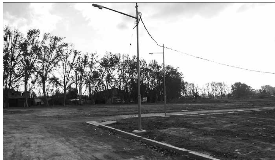
El terreno en donde se construirán las futuras viviendas.

A través de un programa municipal, familias adjudicatarias firmaron las carpetas para el inicio de sus proyectos habitacionales.