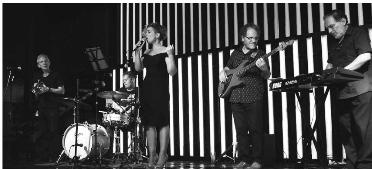
Guaymallén siempre tuvo una inclinación por el jazz y hubo muchas presentaciones en vivo.