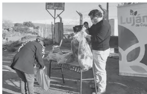
Los vecinos podrán comprar verduras, frutas y otros productos.

El Área de Economía Social de la Secretaría de Desarrollo Humano de la Comuna de Luján lleva adelante el programa El productor más cerca destinado a los consumidores lujaninos donde pueden encontrar puestos de verduras y frutas, carne y pescado de primera calidad, a un precio accesible. La feria se realiza al aire libre con modali-