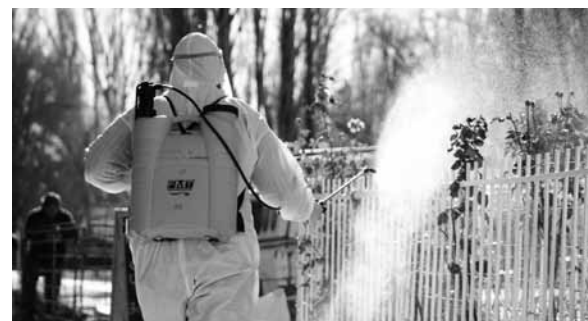
Se cuida a los uspallatinos.

Del operativo sanitario se encargó el área de Salud de la Secretaría de Gobierno de la Municipalidad, comandada por Ja-