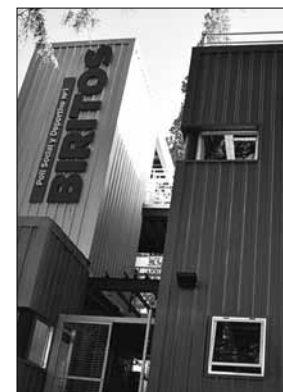
Uno de los puntos, el poli Biritos.

Los puntos de wifi son: • Polideportivo social y