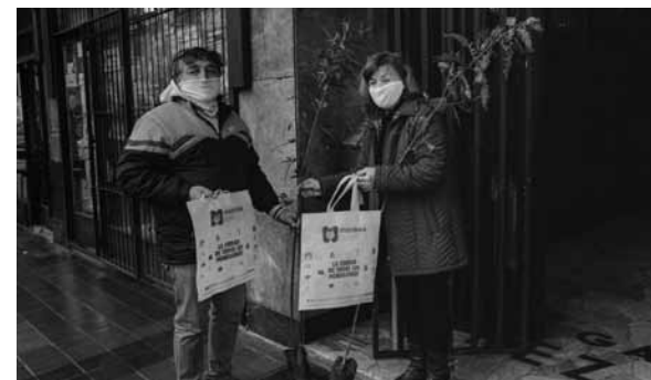
Fueron varios los vecinos que recibieron sus ejemplares.

Esta acción se da en el marco de la celebración Día del Ambiente. En tal sentido, el Gobierno de Mendoza inauguró este programa, denominado "Amigo Árbol", que está di-