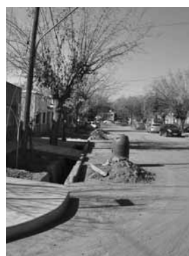
Mejoras en el barrio.

emplazan por cunetas revestidas en hormigón, a lo que se suma la construcción de cordones y banquetas con el mismo material. La infraestruc-