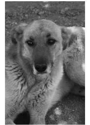
Atención a las mascotas.